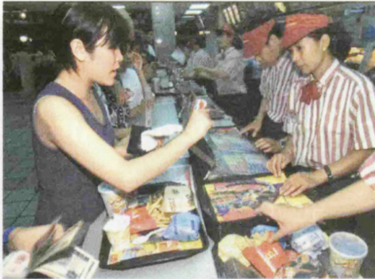
China Suma nuevos consumidores que demandan más alimentos.

“Una de las cosas que tenemos que definir (y mejorar) es nuestra inserción en el mundo”, opina Schuster . Menciona como parámetro que, en inversión extranjera directa, el país está de-